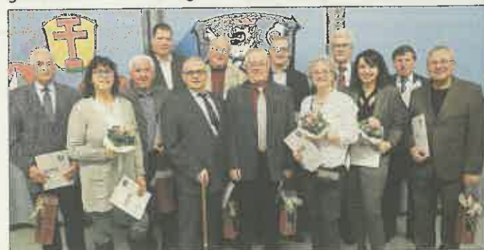
Stadt Ehrungsmarathon – hier ein Archivfoto vom Neujahrsempfang am 8. Januar 2017 – gibt es zukünftig ganzjährig Ehrungen innerhalb der Vereine

Die Ehrungssatzung als Grundlage ist auf der Homepage der Stadt nachzulesen: http://www.riedstadt.de/nc/rathaus/rathaus/satzungen/ehrenamtsfoerderung/download/ehrungssatzung.html .