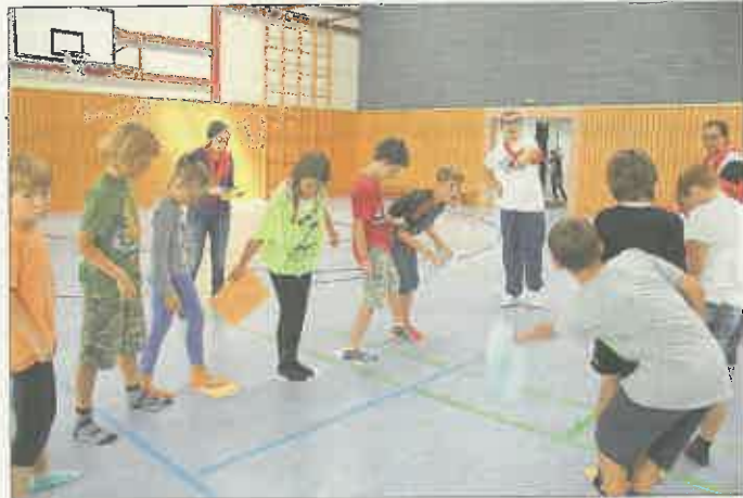
Spaß in der Gemeinschaft bei den Sommerferien zu Hause