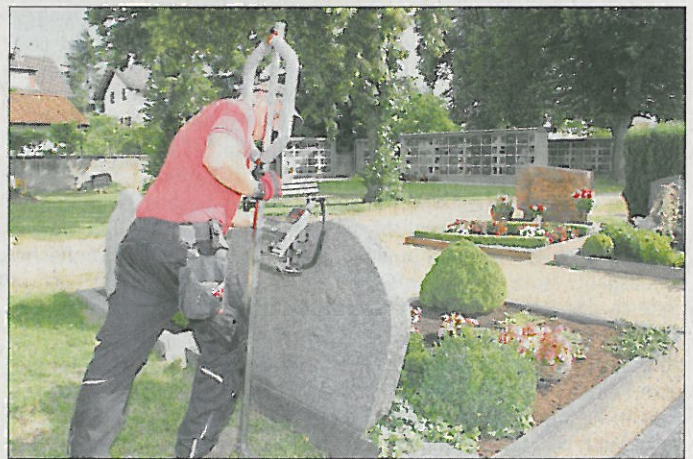
Sicherheitsprüfung von Grabsteinen