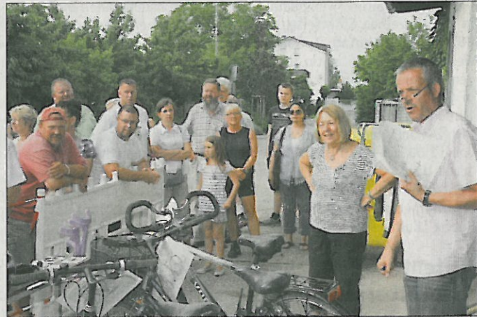
Schnäppchenjäger aufgepasst: Fundamt versteigert Fahrräder (Archivfoto 2012, haza-foto.com)

Meistbietend versteigert werden insbesondere aufgefundene Fahrräder. Außerdem sind eine Angel, ein Unfallaufnahmeset mit Fotoapparat sowie ein digitaler Kompass und etwas Modeschmuck im Angebot. Ab 17:00 Uhr können Bieter die zur Auktion stehenden Gegenstände besichtigen. Die Abgabe der ersteigerten Ware kann nur gegen Barzahlung erfolgen. Ersteigerte Waren können nicht gelagert werden und sind nach Abschluss der Versteigerung mitzunehmen.