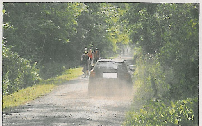
Autofahrer verursachen starke Staubentwicklung.

Die Maßnahme war bereits im vergangenen Jahr im Umweltausschuss und später bei einer Bürgerversammlung in Riedstadt-Erfelden vorgestellt und dort teilweise kontrovers diskutiert worden. Deshalb soll die Sperrung in diesem Jahr erst einmal probeweise durchgeführt werden. Anschließend bewerten das Regierungspräsidium, die Stadt Riedstadt und das für die Betreuung des Naturschutzgebietes zuständige Forstamt Groß-Gerau die gemachten Erfahrungen und entscheiden, ob die Sperrung auch in den kommenden Jahren veranlasst werden soll. Regierungspräsident Johannes Baron begrüßt die Entscheidung der Stadt: „Es ist erfreulich, dass die Stadt Riedstadt die Bemühungen des Regierungspräsidiums um eine Beruhigung des größten hessischen Naturschutzgebietes Kühkopf-Knoblochsau unterstützt. Die erholungssuchenden Bürgerinnen und Bürger erhalten damit die Möglichkeit, an Wochenenden und Feiertagen die einzigartige Natur der Auenlandschaft ohne störenden KFZ-Verkehr genießen zu können.“